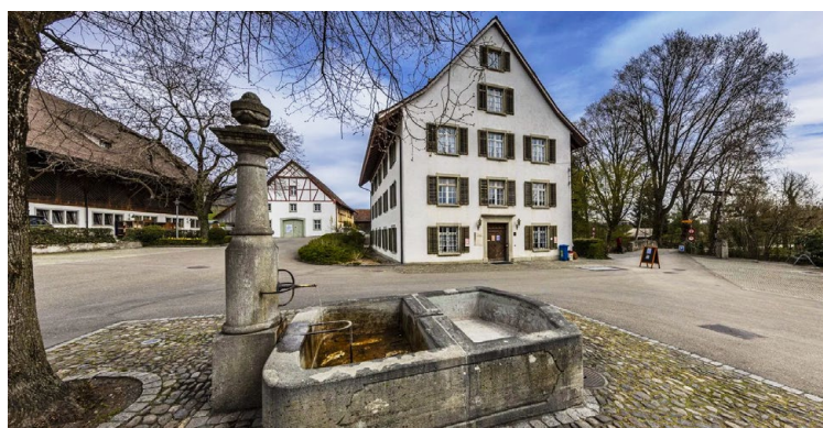
◀ Schauplatz der diesjährigen Delegiertenversammlung im Kloster Fahr

www.prosperita.ch > Schulungen / Veranstaltungen > Delegiertenversammlung