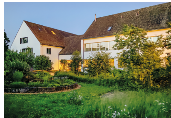
L'école de paysannes transformée