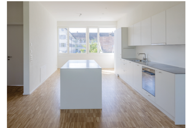
Vue sur le couvent Fahr