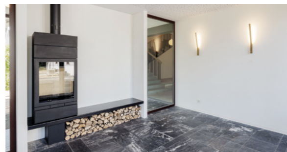
Entrée avec salle de cheminée