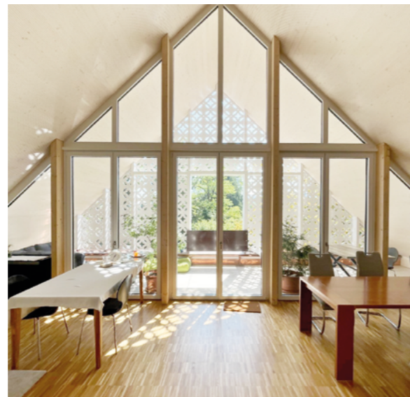
Salle de séjour de l'appartement cluster avec véranda