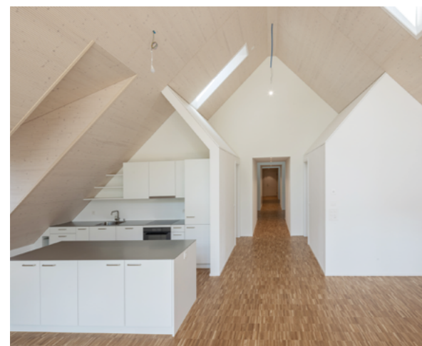
Cuisine-séjour dans l'appartement cluster