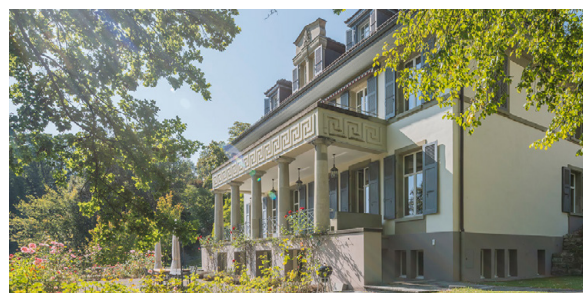
Le nouveau siège de PROSPERITA

Le déménagement de PROSPERITA est devenu nécessaire parce que les précédents locaux étaient trop exigus pour l'administration et que PROSPERITA passe à une nouvelle solution de gestion le 1 er janvier 2021. À la Taubenstrasse 32, la direction a trouvé des locaux appropriés dans un endroit de premier choix à des conditions de location équitables. Elle partage le bâtiment avec trois autres sociétés.