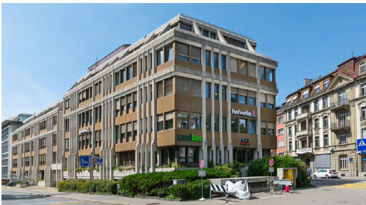
Immeuble de bureaux situé Länggassstrasse 7, près de la gare de Berne

Plus d'informations sur les surfaces de bureaux de PROSPERITA: www.prosperita.ch > News