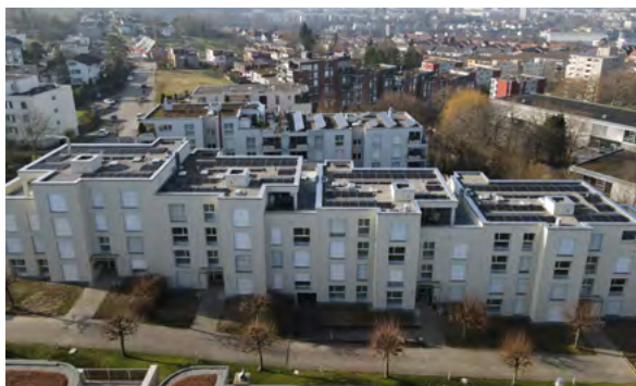
Propriété rénovée à Olten

Les 28 locataires pourront profiter de l'électricité solaire produite par l'installation photovoltaïque sur les toits depuis le début de l'année 2024. Les excédents sont injectés dans le réseau local contre un remboursement. Les 152 panneaux devraient produire environ 60 000 kWh sur l'année.