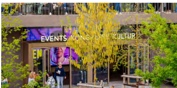
Le centre de congrès ENTRA à Rapperswil constitue le cadre idéal pour ces festivités