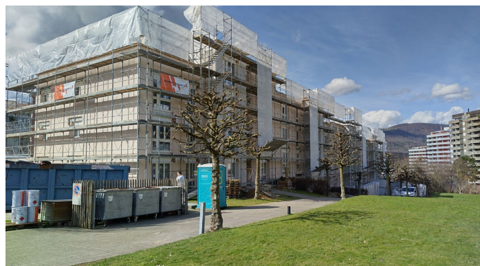
▲ Rénovation énergétique de l'enveloppe extérieure à Olten