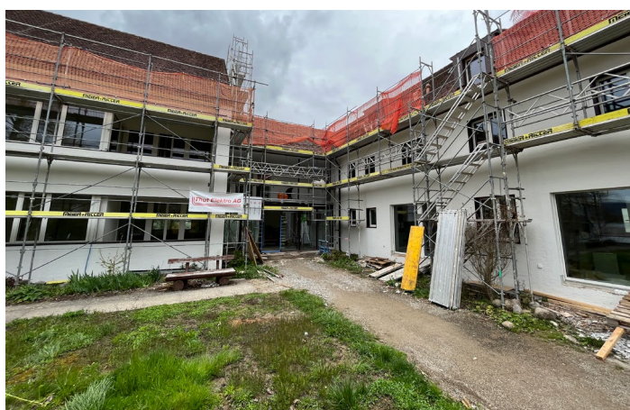
▲ La maison multigénérationnelle « Fahr11 » bientôt terminée