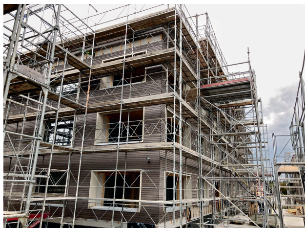
«swisswoodhouse» in Möriken AG

Am 21. September 2018 wurde die Aufrichtefeier der Überbauung in Möriken AG gefeiert, an der auch die PROSPERITA beteiligt ist. Die nach Minergie-P und Minergie-ECO zertifizierte Überbauung ist etappenweise bezugsbereit, das Mehrfamilienhaus der PROSPERITA ab Juni 2019. Mietinteressenten können sich bereits jetzt bei Straub & Partner AG, Lenzburg, www.straub-partner.ch oder 062 885 80 60 melden.