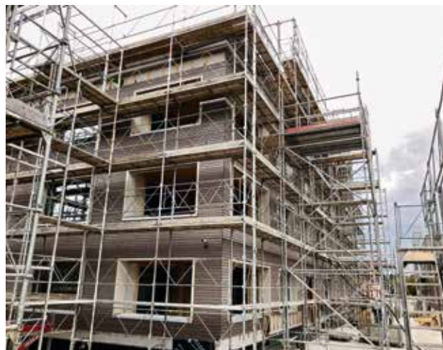
« swisswoodhouse » à Möriken AG

Le 21 septembre 2018, on a fêté le bouquet de chantier du lotissement à Möriken dans le canton d'Argovie, auquel PROSPERITA participe. Ce lotissement certifié Minergie-P et Minergie-ECO sera prêt à l'occupation par étapes, l'immeuble locatif de PROSPERITA le sera dès juin 2019. Les personnes intéressées à devenir locataires peuvent déjà s'inscrire auprès de Straub & Partner AG, Lenzburg, www.straub-partner.ch ou au 062 885 80 60.