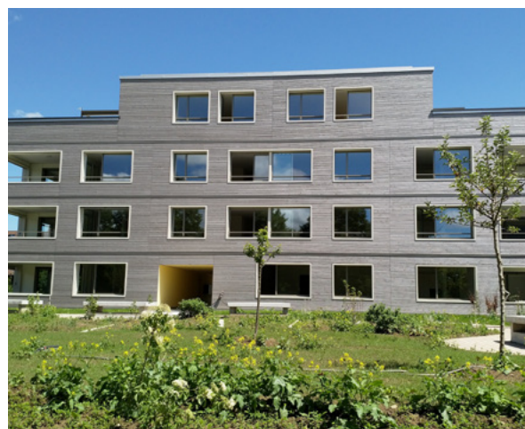
Immeuble d'appartements achevé en 2019 à Möriken AG

également appliquée automatiquement si le taux d'intérêt de référence augmente à nouveau à l'avenir.